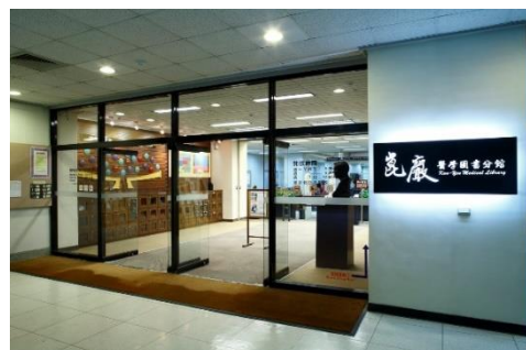
【成大醫學院第三講堂旁邊】