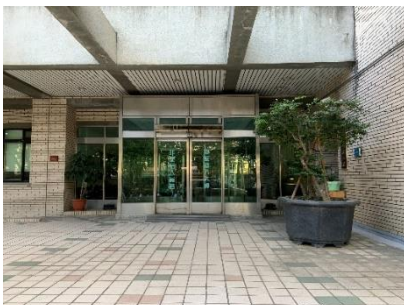
【杏一醫療用品店的斜對面】